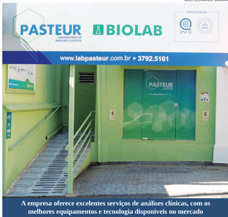
A empresa oferece excelentes serviços de análises clínicas, com os melhores equipamentos e tecnologia disponíveis no mercado

Os cuidados com a saúde não se restringem apenas ao momento da consulta médica, mas se estendem até o momento da realização de um exame que na maioria das vezes, é primordial para o médico estabelecer o diagnóstico do paciente. Para