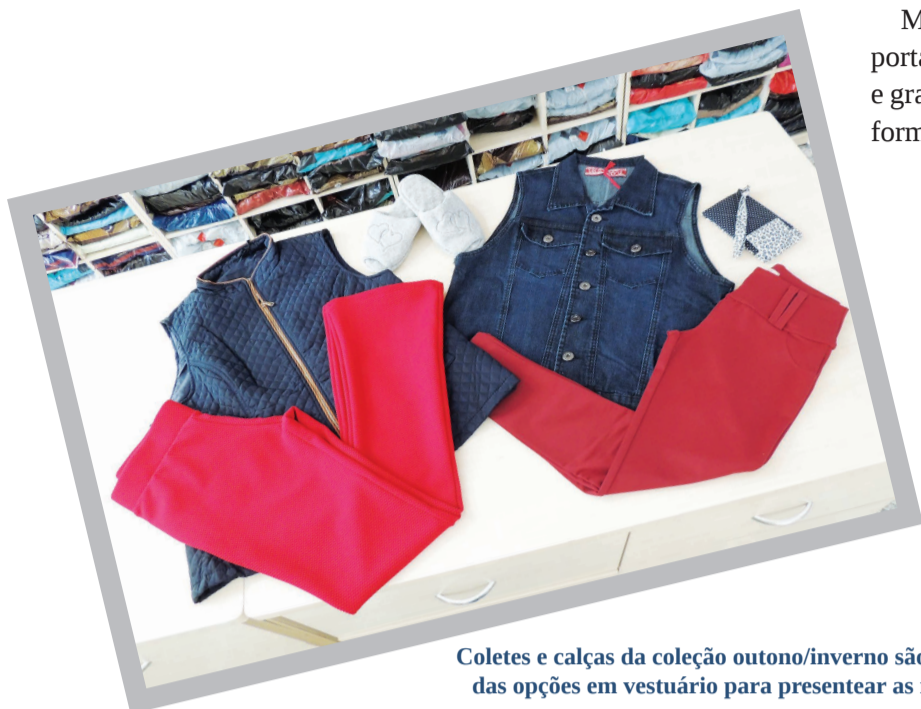
Coletes e calças da coleção outono/inverno são algumas das opções em vestuário para presentear as mães

Maio, além de trazer uma amostra de como será o inverno, traz consigo uma das datas mais importantes para o comércio e consumidor: o Dia das Mães. Além de demonstrar todo o amor, carinho e gratidão por esta que é uma das figuras femininas mais importantes na vida de uma pessoa, uma das formas que se encontra de demonstrar todo este afeto é através de um presente.