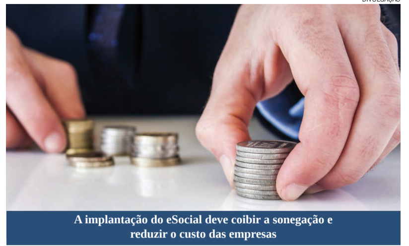
A implantação do eSocial deve coibir a sonegação e reduzir o custo das empresas

sas terão reduzidas as chamadas obrigações acessórias (declarações, guias, cadastros) que hoje devem ser obrigatoriamente enviadas à Receita, Ministério do Trabalho, Caixa Econômica Federal e Previdência Social. Na