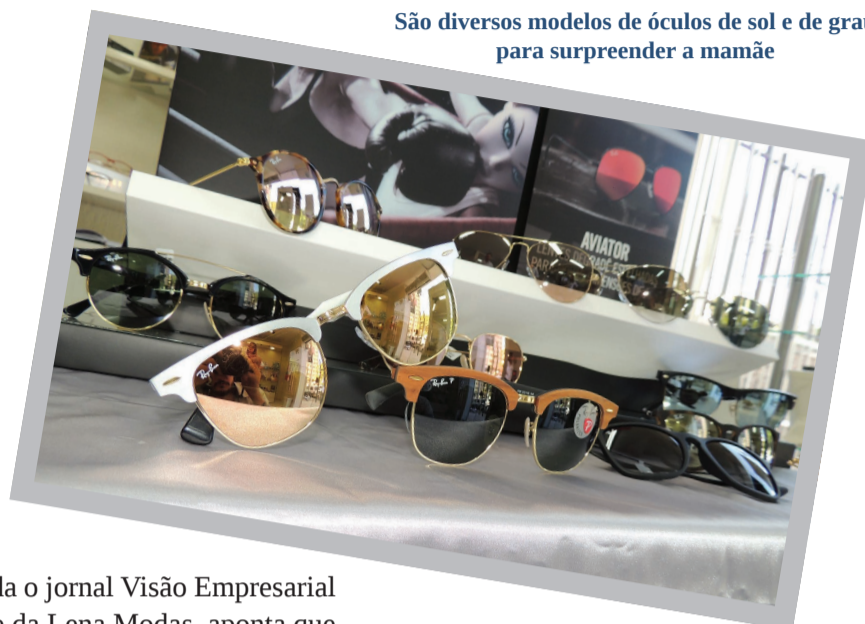
São diversos modelos de óculos de sol e de grau para surpreender a mamãe