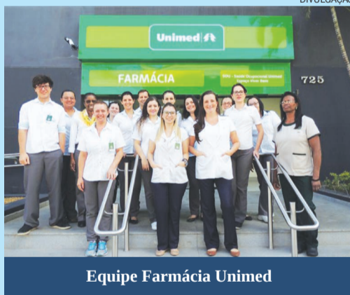
Equipe Farmácia Unimed

Com bastante praticidade, tanto informações como pedidos de medicamentos podem ser realizados através do e-mail: televentas.farmacia@unimedlimeira.com.br , pelo telefone (19) 3404-5040 e pelo WhatsApp (19) 97122-2935.